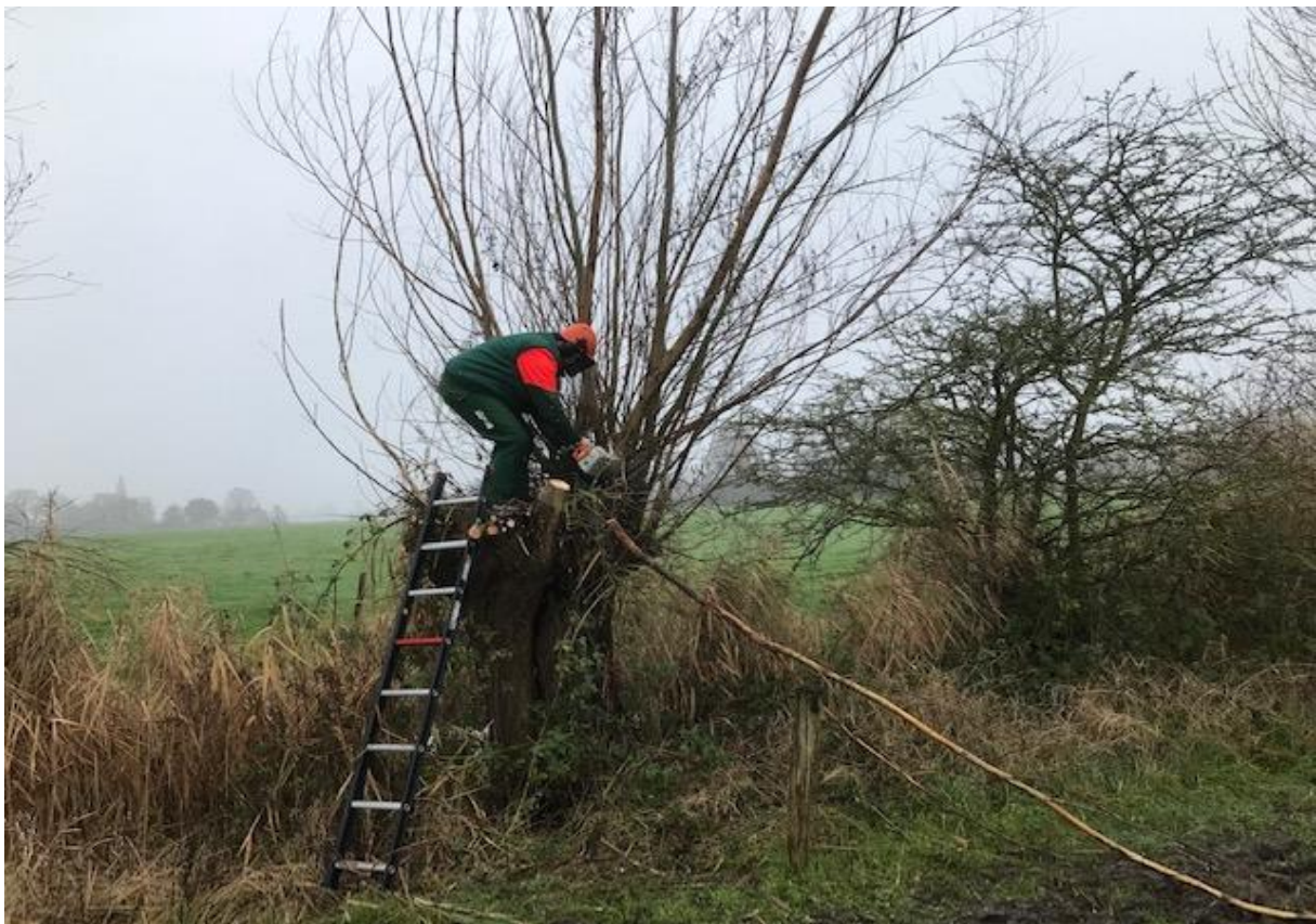
Hilco in actie, staand op een wilg naast de Bulsinkbeek.

Op vrijdag kon de motorstokzaag nog ingezet worden, op de zaterdag gaf deze zaag al spoedig de geest. Derhalve zijn toen als vanouds de ladders weer tegen de boom gezet. Er is aan weerszijden van de beek gewerkt dus de corona afstand werd ruim in acht genomen. Er bleven enkele wilgen ongeknot evenals enkele essen. Zo gauw het weer kan pakken we deze aan.