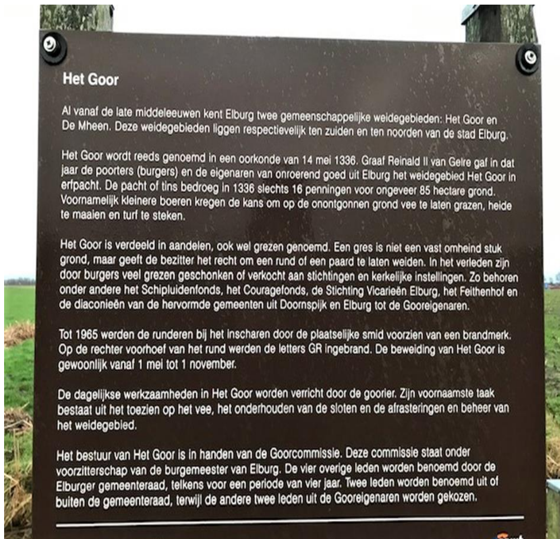
Dit informatiebord staat bij het klaphekje aan het eind van het Goorpad.