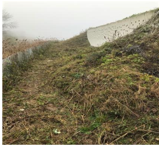
Het ziet er weer redelijk uit.