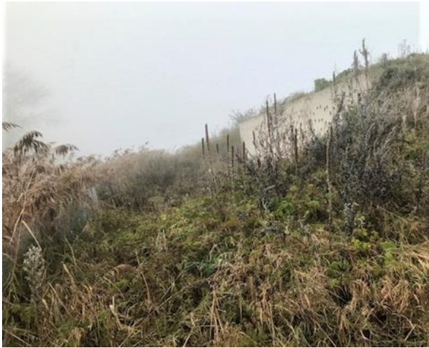
Het wild begroeide terrein.